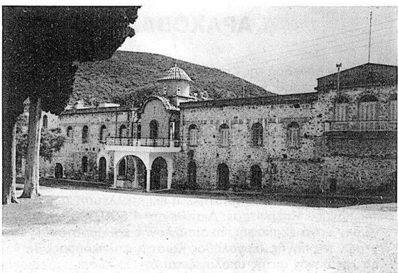
Η ιστορική μονή Αγίων Τεσσαράκοντα