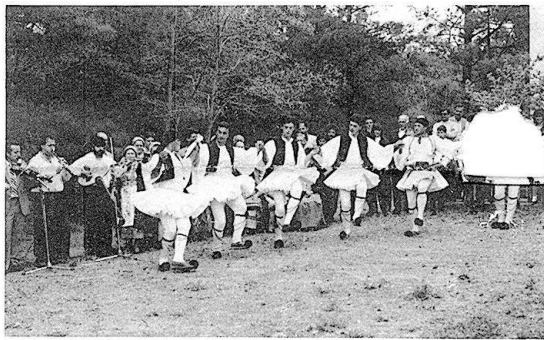
Παραδοσιακό γλέντι στον Άγιο Κωνσταντίνο

Το Σεπτέμβρη υπολογίζεται ότι θα προβληθεί από την τηλεόραση η ταινία, η οποία θα προβάλλει τις ομορφιές του χωριού.